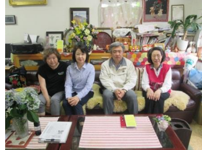
株式会社エーナ介護センターの皆さん

「特殊詐欺根絶アクションプログラム・東京」参加企業の中で、本年4月中でコンテンツの実施回数が多かった「株式会社エーナ介護センター」様にお話を伺いました。